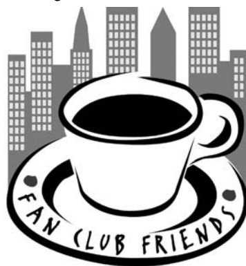
Le Fan Club